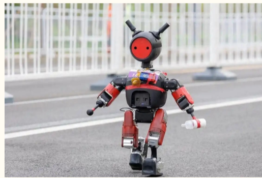
身高仅75厘米、头顶天线、手里拿着奶瓶的“小不点”——小派。

在2026年4月19日举办的“北京亦庄半程马拉松暨人形机器人半程马拉松”中，来自深圳荣耀智慧科技开发有限公司齐天大圣队的“闪电”机器人，以50分26秒的净计时成绩夺得冠军。这一成绩不仅将去年（2025年）机器人冠军的2小时40分42秒大幅压缩了近三分之二，更超越了当前57分20秒的人类男子半程马拉松世界纪录，创造了人机竞速的新历史。