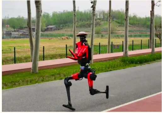
机器人马拉松比赛，“闪电”机器人，以50分26秒的净计时成绩夺得冠军。